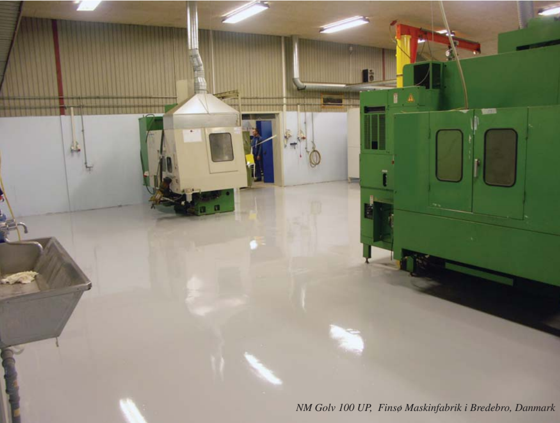
NM Golv 100 UP, Finsø Maskinfabrik i Bredebro, Danmark