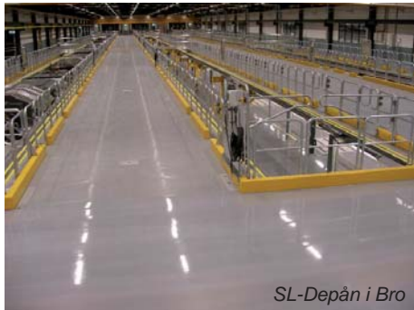
SL-Depån i Bro